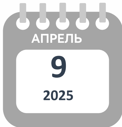
РИС ГИА-11 сформирована и готова к проведению итогового сочинения (изложения):

Зарегистрировано 24 701 участника, в т.ч.: